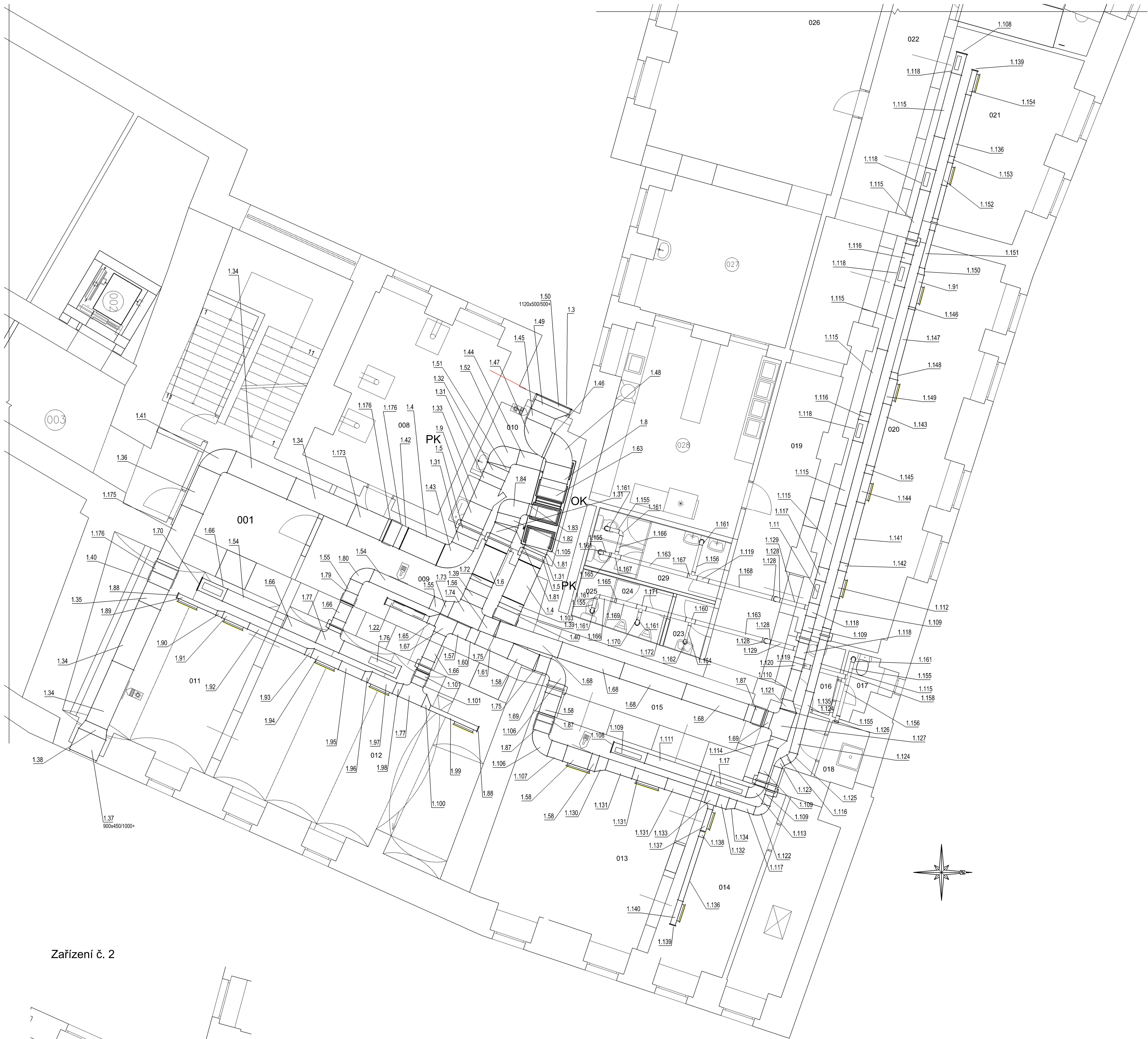
Zařízení č. 2